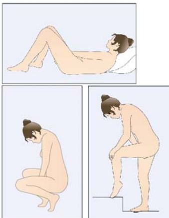
Figure 1 : Positions pour l'insertion de NuvaRing.